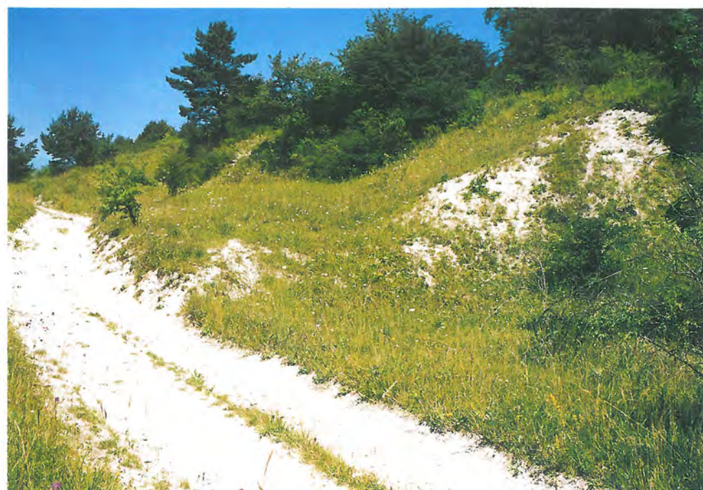
Fragmenty tzv. bílých strání na jihovýchodním svahu Hradiště patří k nejpestřejším entomocenózám tzv. Dlouhé meze.