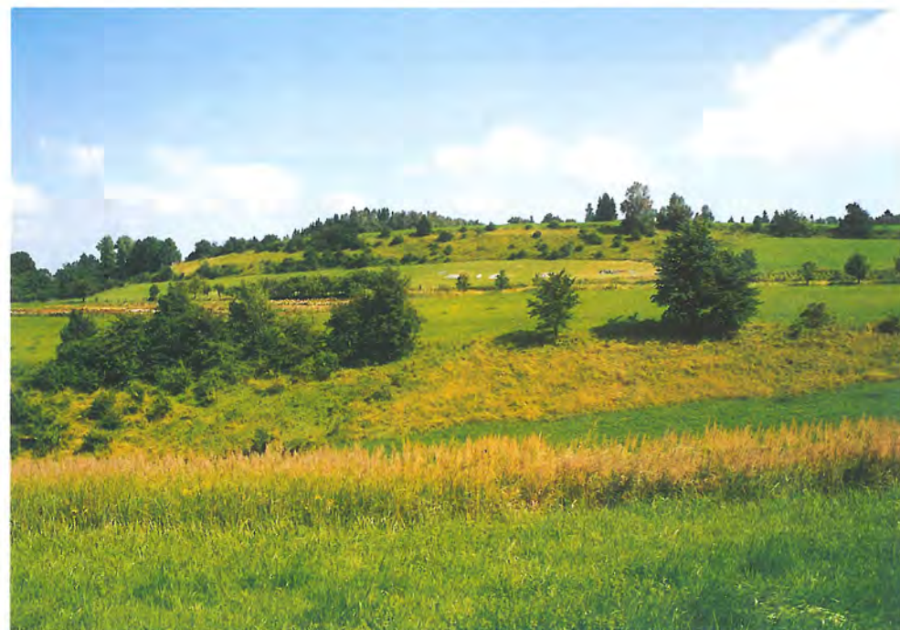
Xerothermní stráně tzv. Dlouhé meze u obce Malochyně.