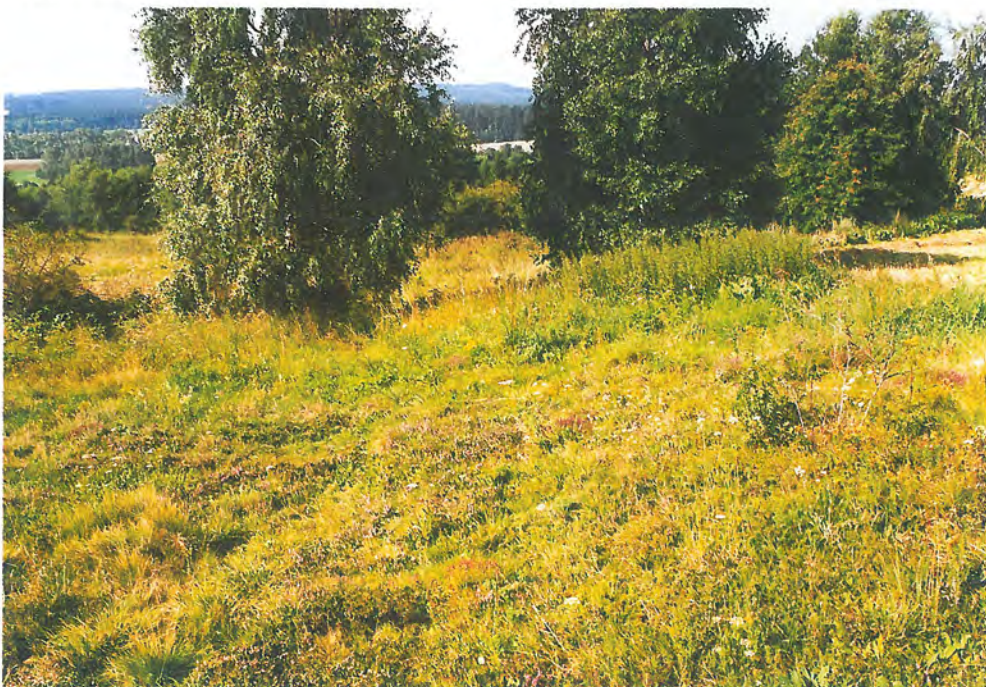
Krátkostébelné acidofilní trávníky s dominantní smilkou tuhou a vřesem obecným v bezprostředním okolí lapače v PR Zubří.