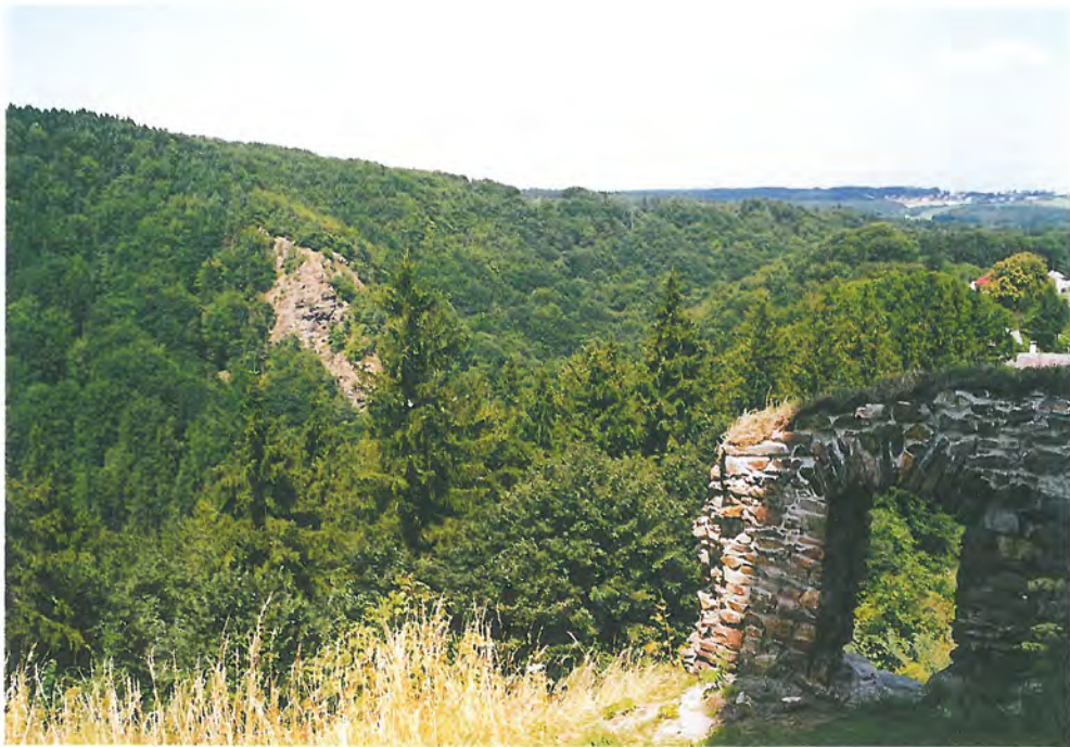
Pohled na komplexy listnatých lesů Lovětínské rokle v NPR Lichnice - Kaňkovy hory se skalními bezlesými výchozy. V popředí zbytky zříceniny hradu Lichnice.